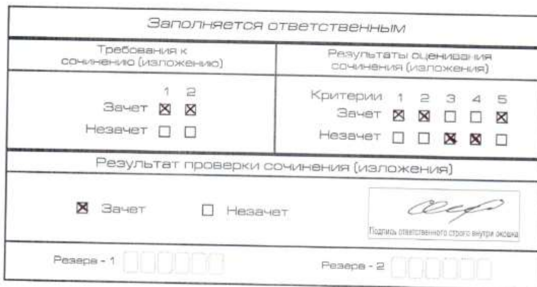
Рис. 6. Область для оценки работы

После окончания заполнения бланка регистрации ответственное лицо ставит свою подпись в специально отведенном для этого поле.