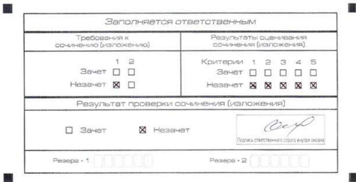
Рис. 5. Область для оценки работы

Эксперт комиссии (ответственное лицо) выставляет «незачет» за невыполнение требования № 2. В клетки по всем пяти критериям оценивания выставляется «незачет». В поле «Результат проверки сочинения (изложения)» ставится «незачет».